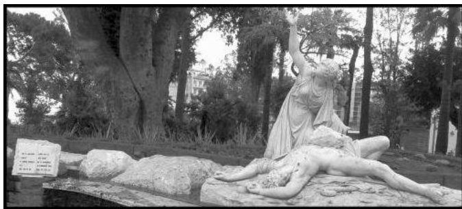
“Aci e Galatea”