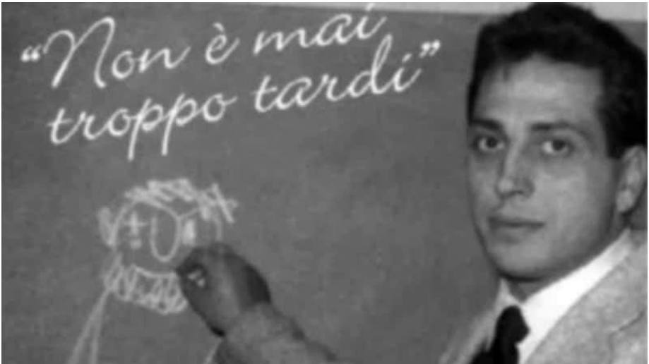
(Alberto Manzi, 1924-1997, didatta)

Più leggo, più imparo, più sono certo di non sapere nulla.